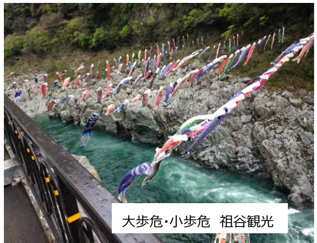
大歩危・小歩危 祖谷観光