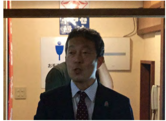
宮地電機株式会社 株式会社アイゴツソ高知 宮地様