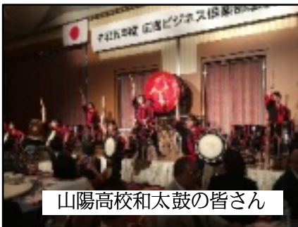
山陽高校和太鼓の皆さん

相手の想像を超える結 果を出したとき、また細 かなことでも全力を尽く すことが相手の心に強く 響き、それで得た信頼は こちらが期待するまでも なく後々さまざまな方面 に生きてくる・・・という ような内容でした。